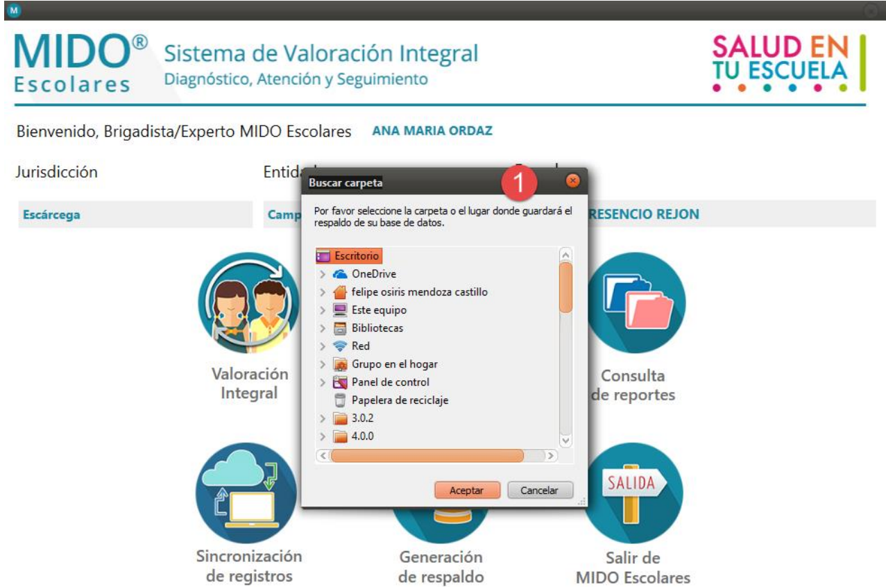
1. Cuadro de búsqueda del sistema para la generación de un respaldo de la base de datos local.